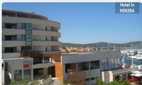
Hotel In NEKERA