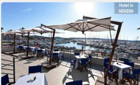
Hotel In NEKERA