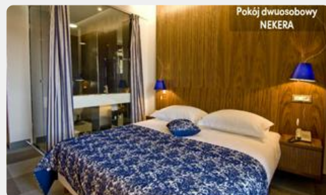
Pokój dwuosobowy NEKERA