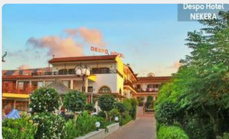
Despo Hotel NEKERA