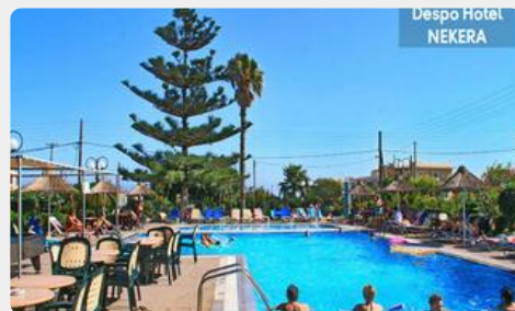
Despo Hotel NEKERA