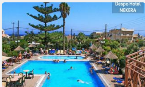
Despo Hotel NEKERA