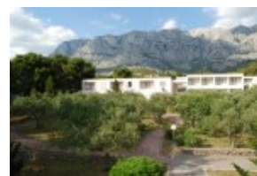
pawilony Elwira w otoczeniu zieleni