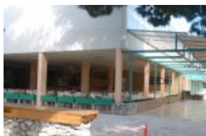
kawiarnia na tarasie hotelu