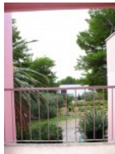
widok z pokoju