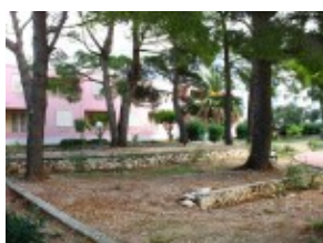
widok na pawilon Barbara