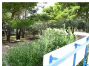
widok z balkonu