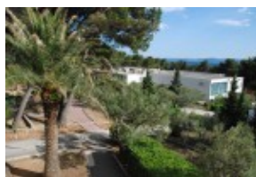
widok z ogrodu