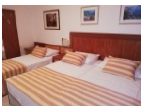
pokój 3- osobowy