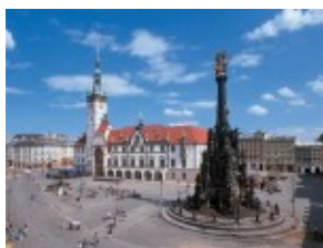
Ołomuniec - Górny Rynek