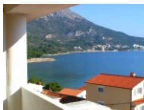
Igrane widok z balkonu