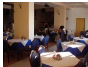
Pensjonat MIHALJEVIC Jadalnia